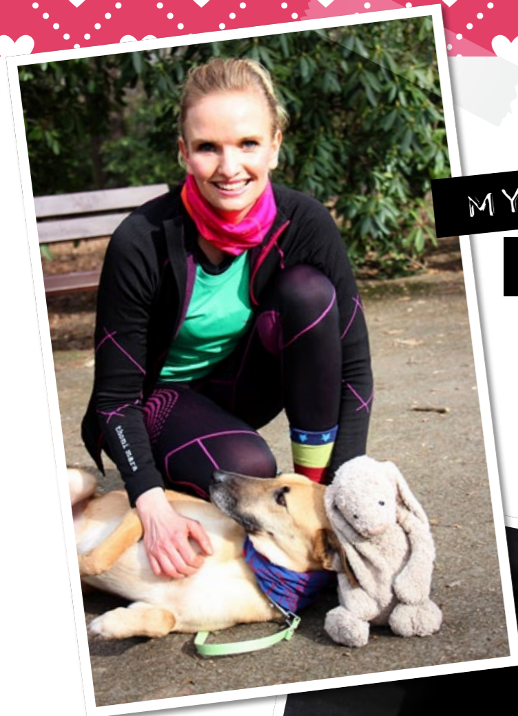
MYLO, MUM & ICH