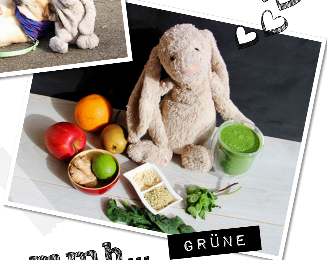
mmh... GRÜNE SMOOTHIES